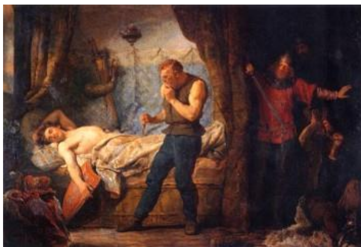
Zabójstwo Przemysława II – obraz Wojciech Gersona

Śmierć Mściwoja II (1294 r.) oznaczała utratę niepodległości, ponieważ państwo wschodniokaszubskie, zgodnie z umową w Kępnie, weszło w skład odradzającej się monarchii polskiej Przemysła II. W 1296 r. Przemysł II został jednak zabity przez Jakuba Kaszubę, będącego prawdopodobnie na usługach Brandenburgii.