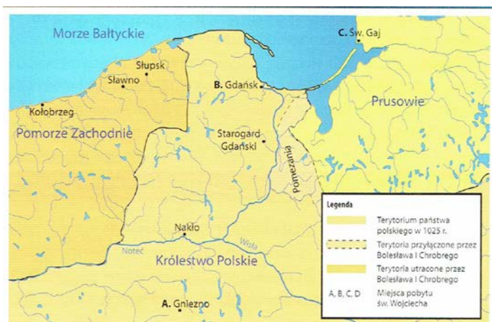
Misja świętego Wojciecha na ziemiach wschodnio-pomorskich

Poniżej załączam skan mapki prezentowanej w tym zadaniu.