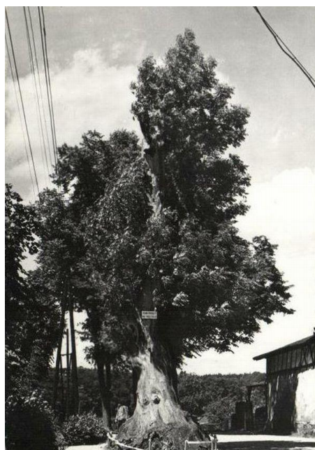
500-letni jesion, rosnący niegdyś nieopodal kartuskiego liceum im. H. Derdowskiego

Szczególną cechą kaszubskiego krajobrazu są pomniki przyrody, czyli pojedyncze twory przyrody żywej i nieożywionej lub ich skupiska o szczególnej wartości przyrodniczej, naukowej, kulturowej, historycznej lub krajobrazowej oraz odznaczające się indywidualnymi cechami, wyróżniającymi je wśród innych tworów, okazałych rozmiarów drzewa, krzewy gatunków rodzimych lub obcych, źródła, wodospady, wywierzyska, skałki, jary, głazy narzutowe oraz jaskinie. Kaszuby wręcz obfitują w głazy narzutowe (nie wszystkie jednak uzyskały status pomnika przyrody), często nazywane diabelskimi kamieniami. Unikatowa jest zaś jaskinia – Groty Mechowskie. Pomniki przyrody ożywionej to przede wszystkim drzewa, zwłaszcza liczące po kilkaset lat lipy, dęby, buki czy jesiony. Niekiedy, pomimo podjętych przez ludzi działań, nie udaje się uratować wiekowych drzew przed wycinką.