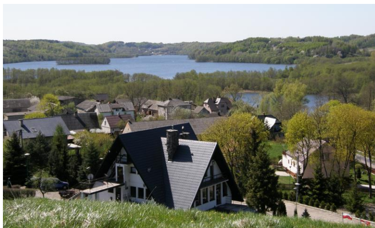
Widok z Sobótki (221 m n.p.m.) koło Ręboszewa

Kaszuby leżą w strefie klimatu umiarkowanego. Położenie nad Bałtykiem sprawia, że zimy na ogół nie są mroźne, a pora letnia nie jest zbyt upalna. Choć warunki klimatyczne są dogodne do rozwoju rolnictwa (w średniowieczu uprawiano na Kaszubach nawet winorośl), to jednak jakość gleb nie jest najlepsza. Na przeważającym obszarze dominują gleby średniej i niskiej jakości. Należy wziąć pod uwagę również ukształtowanie terenu, które jest bardzo zróżnicowane. Charakterystycznym elementem krajobrazu są wysoczyzny morenowe i moreny denne, powstałe w wyniku działalności lądolodu, który ustąpił około 12 tys. lat temu (liczne głazy narzutowe również są efektem działania tego lądolodu). Biorąc pod uwagę powyższe czynniki, należy stwierdzić, że zajmowanie się rolnictwem wymagało wielkiego nakładu sił.