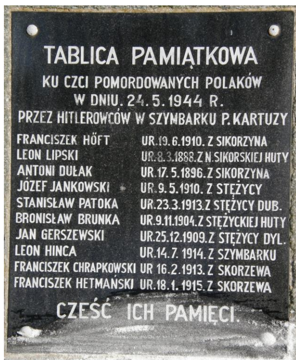
Szymbark – tablica upamiętniająca zamordowanych mieszkańców kilku kaszubskich wsi

Na Kaszubach znajduje się wiele miejsc pamięci związanych z drugą wojną światową, którą upamiętniają liczne pomniki, obeliski, czy specjalne tablice. Wszystkie te formy upamiętniania różnych wydarzeń nie podkreślają jednak udziału w nich Kaszubów.